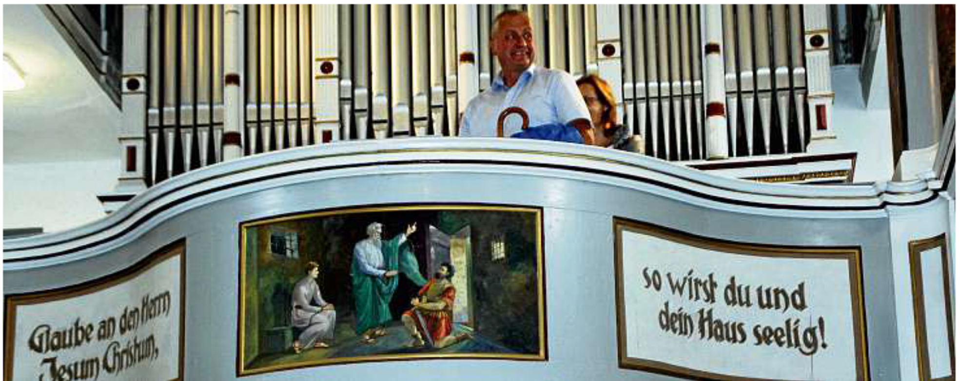
Die Sprüche an den Emporen der Crispendorfer Kirche sind wieder da.